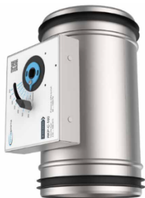
Luchtstroom omhoog Rechte sectie \geq 1 \times \text{Ød}